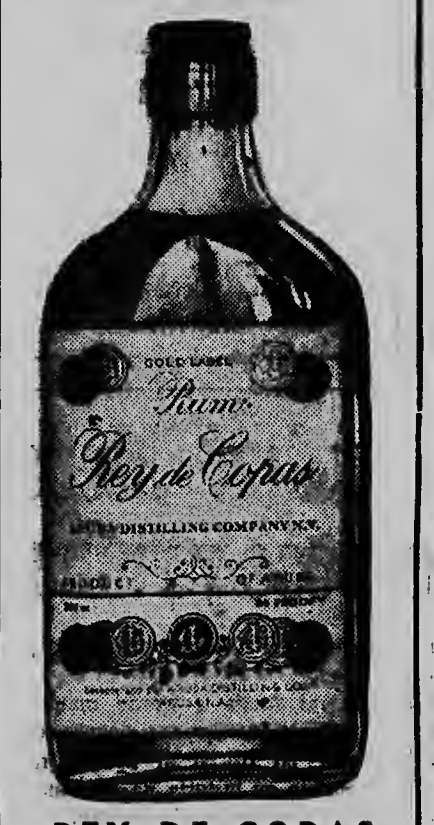
REY DE COPAS ARUBA DISTILLING COMPANY Wilhelminastr. 47 - Tel. 1266